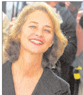
Charlotte Rampling spielt die Hauptrolle im Film «Lemming».

Am meisten zu reden, zumindest in der Lokalpresse in Cannes, gibt jedoch die für Sonntag angesetzte Weltpremiere des letzten Star-Wars-Films von George Lucas mit dem Titel «Star Wars – Episode III – Revenge of the Sith». Der Film läuft ausser Konkurrenz.