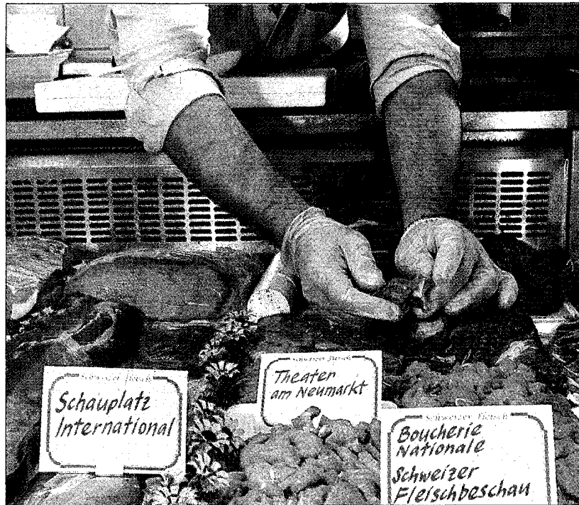
Fleischbeschau zur Qualitätskontrolle: Wer verdient das Label?