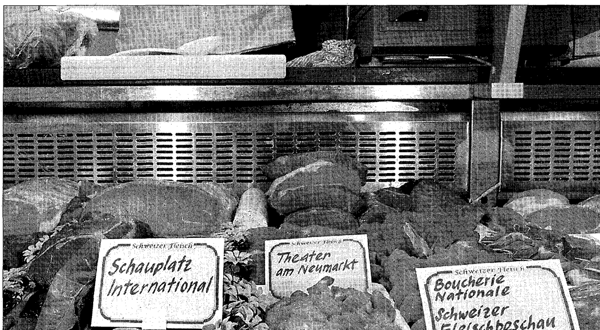
Echtes Schweizer Fleisch? Das Theater am Neumarkt zelebriert eine nationale Fleischbeschau. (Marion Nitsch)